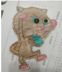
한심한 괴물 레오나르도