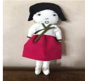
낙점 반 주인공