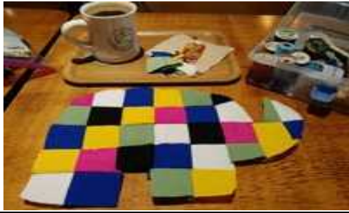
재단 후 바느질하기