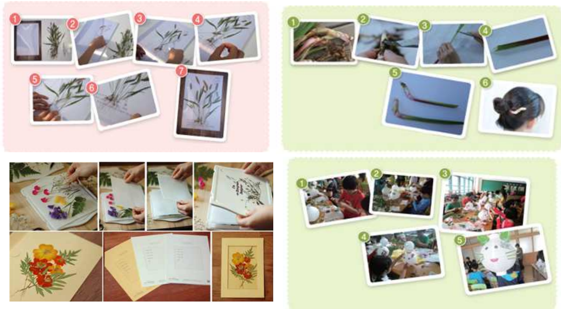
▲잡초표본 만들기, 장포비너 만들기, 꽃등받이기, 즉석식물표본 제작(오른쪽, 시계방향부터)